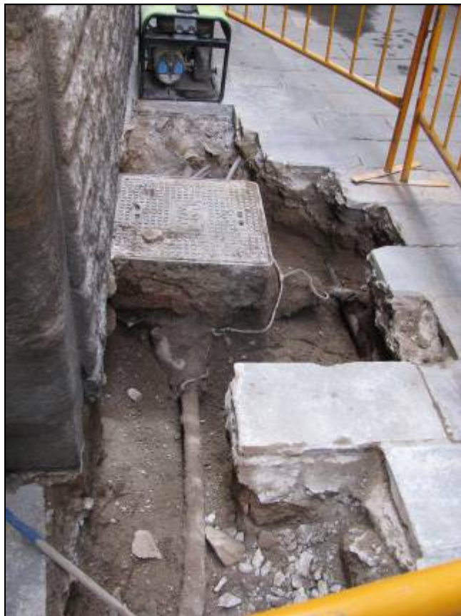
Rasa oberta entre el carrer Sant Sever 4 i Sant Domènec del Call.