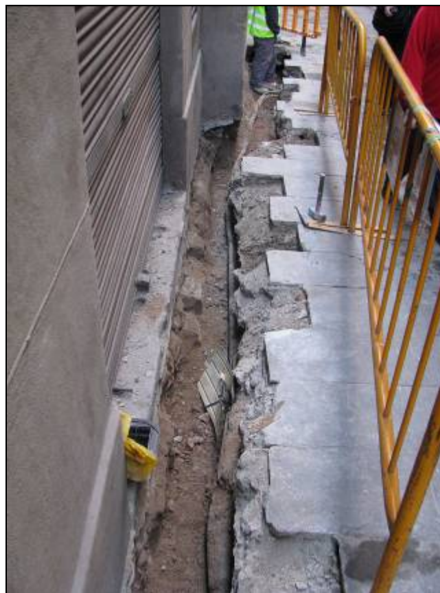
Rasa paral·lela al núm. 8 del carrer sant Sever.