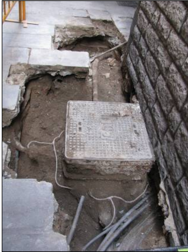
Rasa oberta entre el carrer Sant Sever 4 i Sant Domènec del Call.