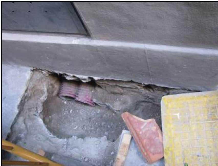
Inici de la rasa davant el núm. 8 del carrer Sant Sever.