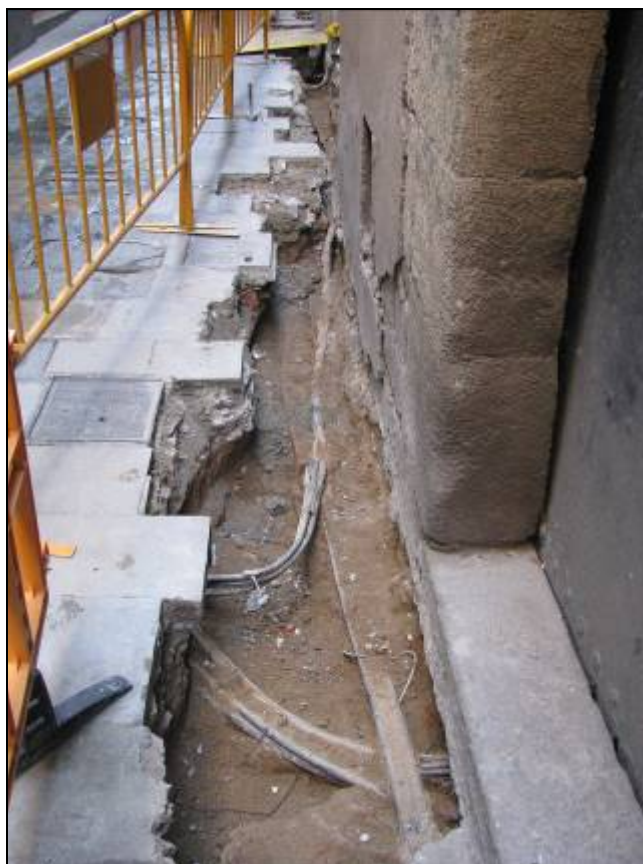
Final de la rasa davant el núm. 6 del carrer Sant Sever.