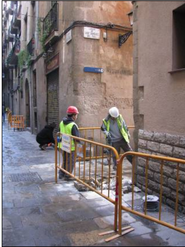
Obertura de la segona rasa a la cantonada Sant Sever/ Sant Domènec del Call.