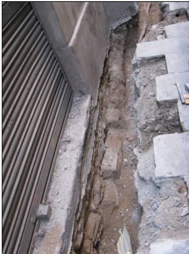
Detall de la fonamentació de la finca núm. 8 del carrer Sant Sever.